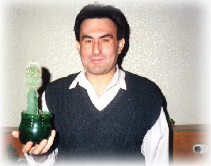
Кактус - "лучший друг" системного программиста СМ ЭВМ. 23 февраля 1995 года

Д.К. «Мужским» праздником. Это праздник - День Рождения, некогда, Советской Армии и Советского Военно-Морского флота. Праздник военных, которые сражались в Гражданскую, Великую Отечественную, в горячих точках и в «Афгане» в наши дни. Праздник настоящих мужчин, которые выбрали своей профессией защиту Родины. В этот праздник принято чествовать живых и вспоминать погиб-